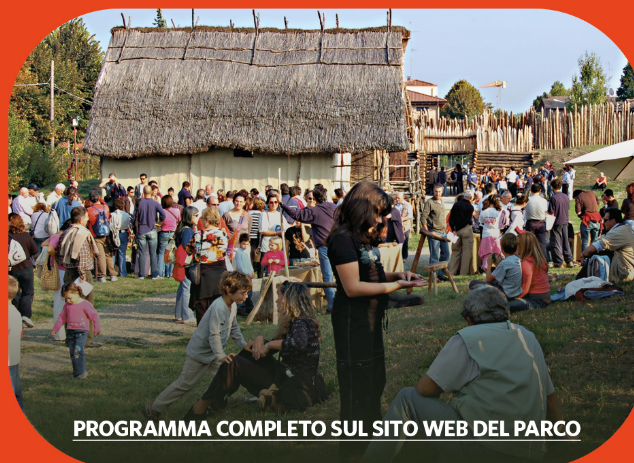
PROGRAMMA COMPLETO SUL SITO WEB DEL PARCO

Le capanne come non le avete mai sentite. L'emozione della visita all'interno delle case della terramara si rinnova con un percorso tra suoni e rumori di 3500 anni fa.